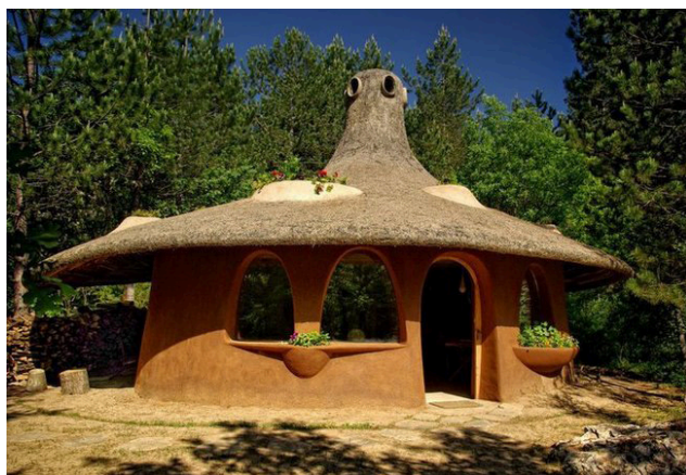
Екоселище „Омая“, област Благоевград 8

Приказната картина се допълва от няколко водоема, в които всеки турист може да усети тръпката от улавянето на щука, сом или пъстърва. Разходките край езерата са истинско удоволствие, а природният пейзаж е толкова красив, че изглежда неестествен - като излязъл от картина. Комплексът предлага много интересни планински маршрути, разходки с лодка и каране на колело в планински условия. Къщичките за гости, изглеждащи отвън като землянки, са наистина уникални. Всяка една от тях предлага луксозната обстановка, необходима за пълноценната почивка на решимите да релаксират сред природата. Интериорите са интересна комбинация от мебели, напомнящи за обстановката на някогашните селски къщи, в която успешно са включени всички удобства, необходими на модерния човек.