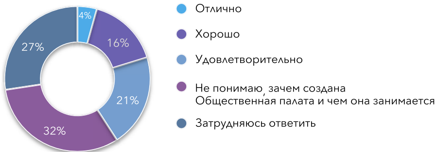
Диаграмма 5.2. Как Вы оцениваете деятельность Общественной палаты РБ? (в процентах)

В 2017 г. 40,9% населения в целом положительно оценивало деятельность Общественной палаты РБ, в 2016 г. – 39,5%, в 2015 г. доля граждан, положительно оценивавших работу Общественной палаты республики, составляла 29,8%.