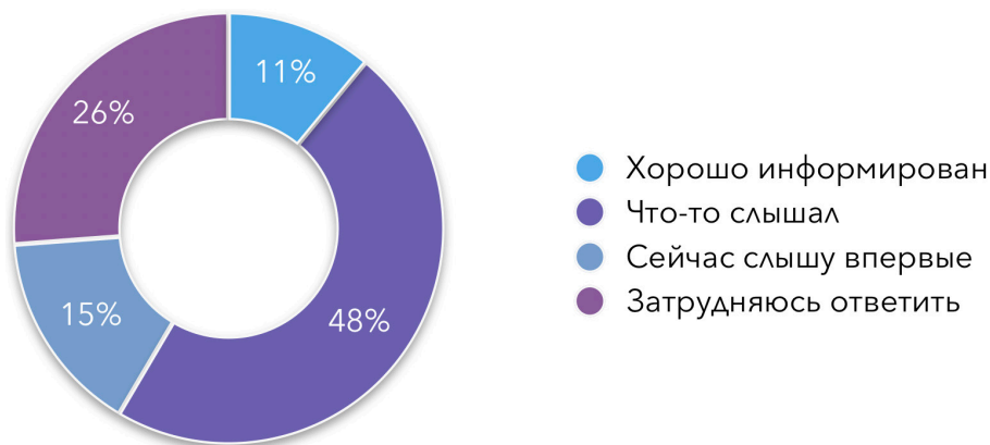
Диаграмма 5.1. Насколько Вы информированы о деятельности Общественной палаты Республики Башкортостан? (в процентах)

От данного показателя во многом зависит и оценка деятельности Общественной палаты РБ гражданами. Так, 31,7% опрошенных не знают функций, которые возложены на палату как на институт-посредник, ещё 27,4% затруднились с ответом. 20,2% опрошенных оценили работу Общественной палаты РБ на «хорошо» и «отлично», ещё 20,7% отметили, что удовлетворены работой данного общественного института. Порядка 59% населения информированы о Общественной палаты РБ, что, в целом, коррелирует и с показателями прошлых лет. Тем не менее наблюдается положительная динамика в вопросе