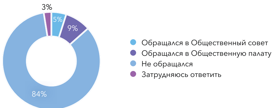
Диаграмма 5.4. Обращались ли Вы по какому-либо вопросу в Общественные палаты при муниципалитетах или Общественную палату? (в процентах)

Соответственно, количество граждан, обратившихся в Общественные палаты, пока остаётся небольшим. 84,1% отмечают, что не обращались в данные структуры ни по какому поводу, но в общей сложности 13,4% отмечают, что такие обращения осуществляли, что можно расценивать как потенциально перспективный показатель (Диаграмма 5.4) [5, С.68].