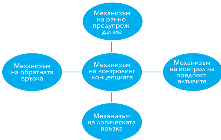
Фигура №2 Контролинг механизми 5

- Механизъм на ранно-предупреждение – съдържанието на този механизъм се фокусира върху хипотезата за предварителната връзка и изпреварващото действие, което дава възможност за превантивно оптимизиране на управленския процес. Това означава, че не се изчаква появата на ефект (позитивен/негативен) от въздействието на определен фактор, а се прави предварителен (изпреварващ) анализ на очакваните ефекти и се предприемат действия за превенция на нежеланите последици. Предварителната връзка се явява свързващия елемент между планиране и превенция, тоест механизмът на ранно-предупредителната система се превръща в ключов управленски инструмент в организацията;