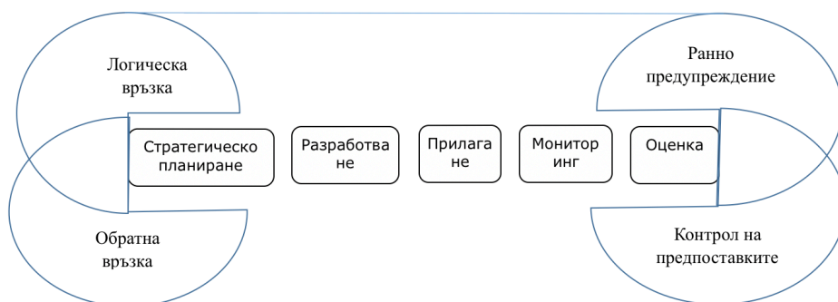
Фигура №3 Имплементиране на контролинг концепцията в процеса на изграждане на публични политики